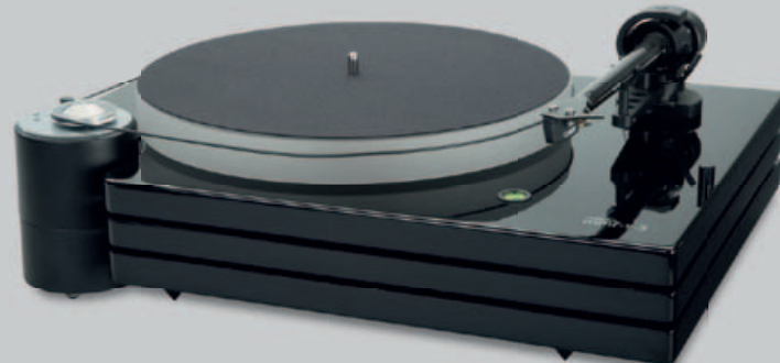
Plattenspieler mmf-9.3 Reichmann-AudioSysteme.de